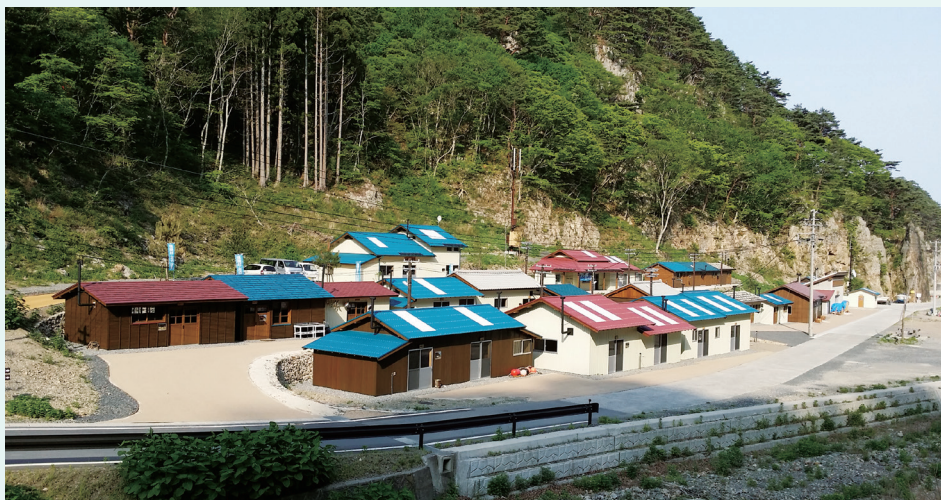
漁村の原風景を今に伝える机浜番屋群が再建された

三方を山に囲まれた地形のため、3月11日当日、番屋や港で作業をしていた漁師たちは、すぐに高台へ避難でき、人的被害はなかった。現在の机浜番屋群は、漁村の原風景を取り戻し、漁村文化と一緒に再生したいと思う人々が「机浜番屋群再生プロジェクト」を立ち上げ、全国からの寄付や国の復興事業により、平成26年12月に以前の面影を復元する形で建てられたものだ。震災以前同様、半数以上の番屋が実際の地元漁師の生業の場として使用されている。と同時に観光交流拠点として、さまざまな活用が進んでいる。中には、昭和当時の漁の様子を紹介する番屋も整備され、自然と融合した漁師文化を今の時代に伝えている。目今の机漁港は、北山崎の断崖絶壁を漁師の小船クルージングする「サッパ船アドベンチャーズ」の発着拠点として、多くの観光客で賑わっている。